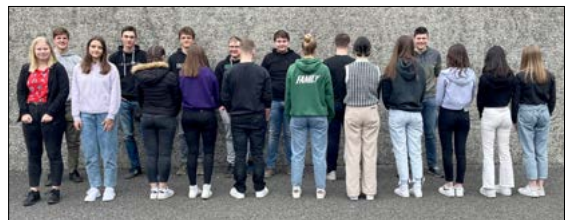
Firm-Gruppe 09.00 Uhr