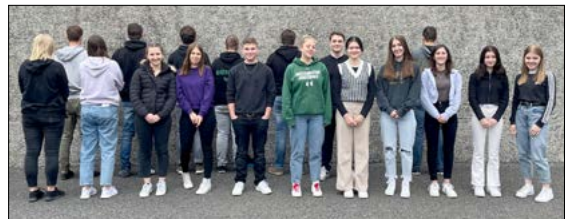
Firm-Gruppe 11.00 Uhr