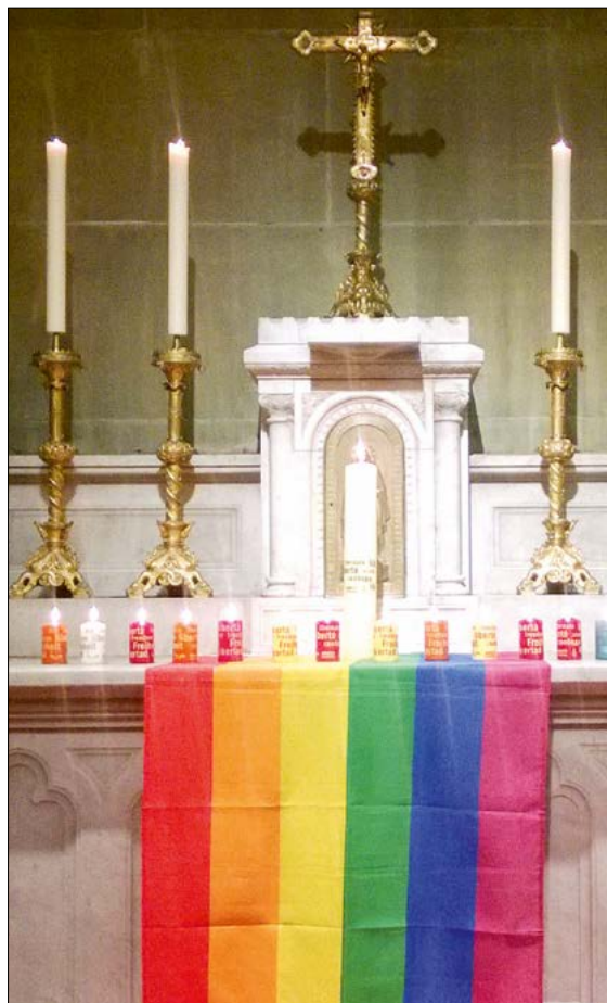
Segensfeier für Homosexuelle in einer Berner Kirche.