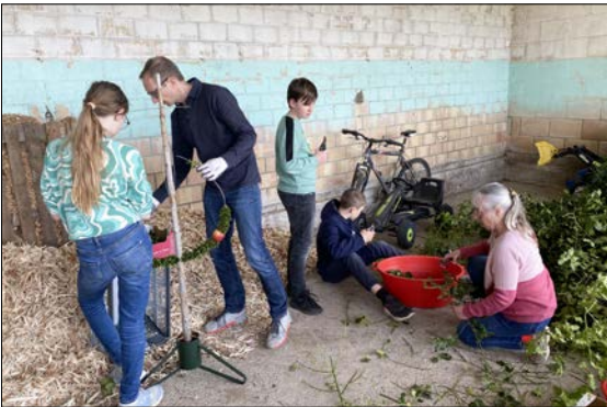
Es wurde fleissig gearbeitet.