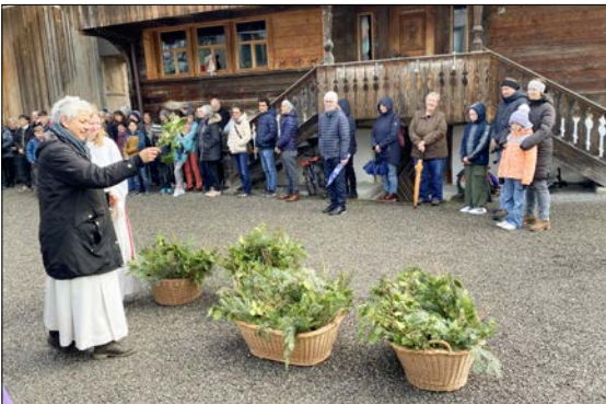
Sie Segnung fand auf dem Margrethenplatz statt.