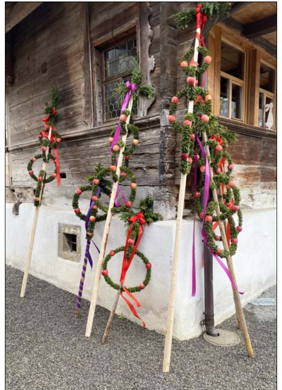
Die fertigen Palmbäume